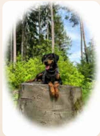
Murphy (2 Jahre) „der Jungspund“ -TBH seit 2024 -liebt es mit Menschen zu arbeiten -kann sehr gut für Übungen rund um Bewegung eingesetzt werden