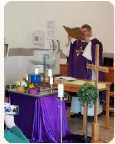
Urnenverabschiedung einer ehemaligen Bewohnerin, Requiemfeier im Föhrenhof!