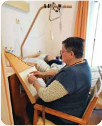
Begleitung bis „zum Einschlafen!“

Das Thema Hospiz und Palliativ ist uns sehr wichtig!