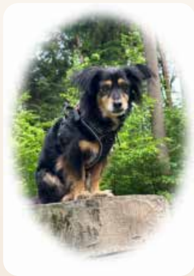
Mia (9 Jahre) „die ruhige Prinzessin“ -TBH seit 2018 -hat viel Erfahrung im Umgang mit Senioren_innen & Kindern -gut einsetzbar unter anderem für Übungen und Spaziergänge