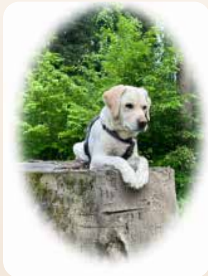
Sandro (5 Jahre) „der Clown“ -TBH seit 2023 -steckt mit seiner guten Laune jeden Menschen an -vielseitig einsetzbar