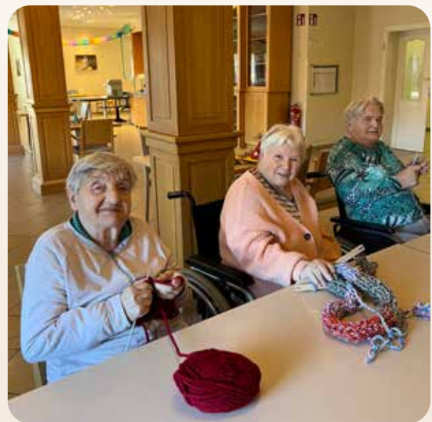
Ein neues Ziel